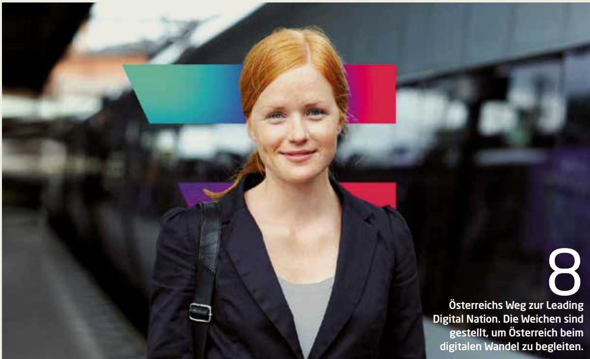
8 Österreichs Weg zur Leading Digital Nation. Die Weichen sind gestellt, um Österreich beim digitalen Wandel zu begleiten.