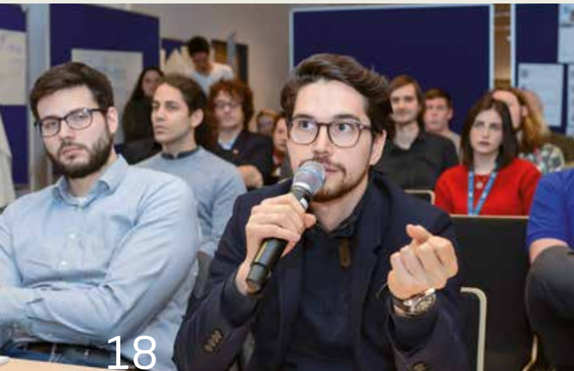
18 Junge IT-Talente beim SHack Vienna auf der Suche nach innovativen Lösungen für eine bessere Zukunft.