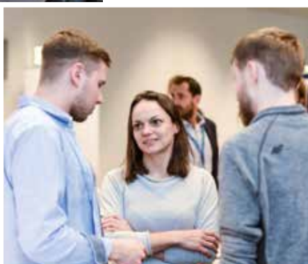
Die Sieger/innen aus dem Team „fit 4 future“, einer Online-Trainingsplattform für Lehrkräfte, kommen aus Österreich, Deutschland und Ungarn.

benachteiligten Personen einfachen Zugang zu staatlichen Förderungen. Eine elfköpfige Fachjury bewertete die Projekte nach Kreativität des Inhalts, digitaler Umsetzung und sozialer Auswirkung. Als Sieger ging das Projekt fit 4 future hervor, den verdienten zweiten Platz machte die App Allio.